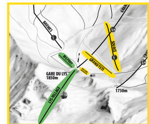
ZOOM ESPACE DÉBUTANT FLEX